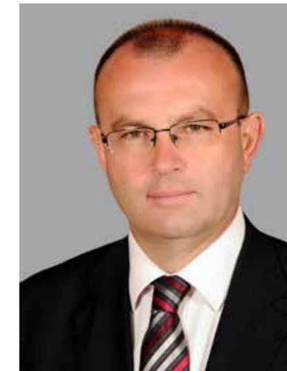
DR. BÓKA ISTVÁN Polgármester — Balatonfüred

lálkozóhelye volt a haladó szellemű polgárságnak és művészeknek, nem csak a virágzó társasági életnek és a tó csodálatos látványának, az itt fakadó, messze földön híres savanyú- és gyógyvizeknek köszönheti mindenkori népszerűségét, hanem a földrajzi fekvésének és klímájának is, amely számos aktív programlehetőséget biztosít a vendégeinek.