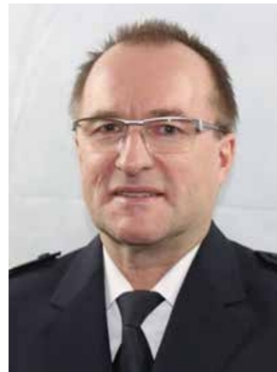
ТОМАС МЕЙЕР председатель – IPMC