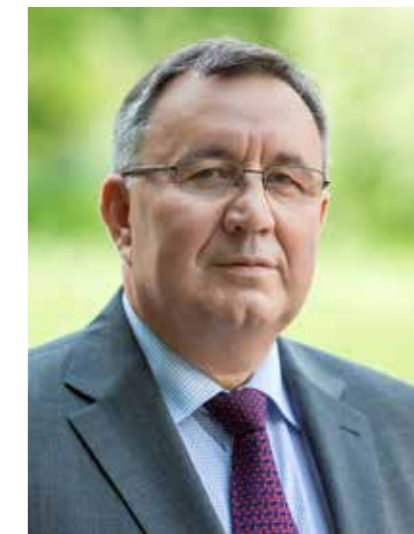
Др. ЙОЖЕФ ХАТАЛА председатель Венгерского автоклуба

Организации, которые учат нас управлять мощностью машины - учат нас принимать ответственные решения, помогают нам ответственно участвовать в транспортном движении, и я ценю это как президент Венгерского автомобильного клуба. Если они также уделяют внимание формированию сообществ, я ценю это с точки зрения профилактики преступности. Поэтому я всегда был и буду рад поддержать организацию встреч родственных международных организаций, эти встречи представляют данные ценности на еще более высоком уровне. Я поощрял это и в качестве подчиненного, и в качестве руководителя национальной полиции.